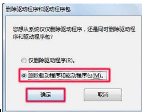
图 5：删除驱动程序包