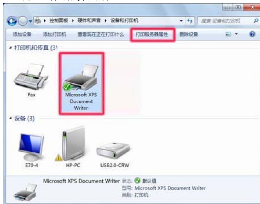
示：图 3：打印服务器属性