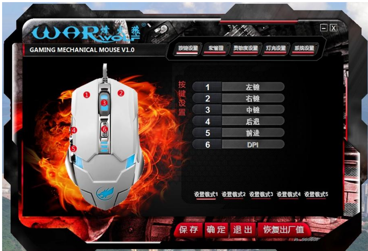
游戏鼠识别前界面