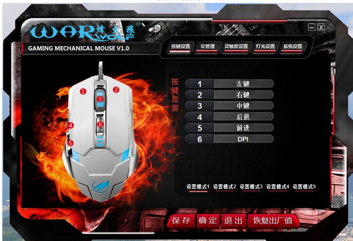
游戏鼠识别后界面