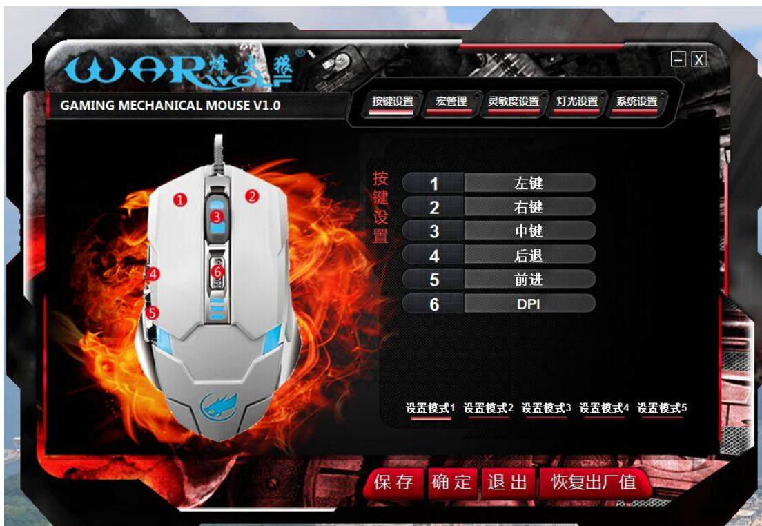
烽火狼游戏鼠驱动界面