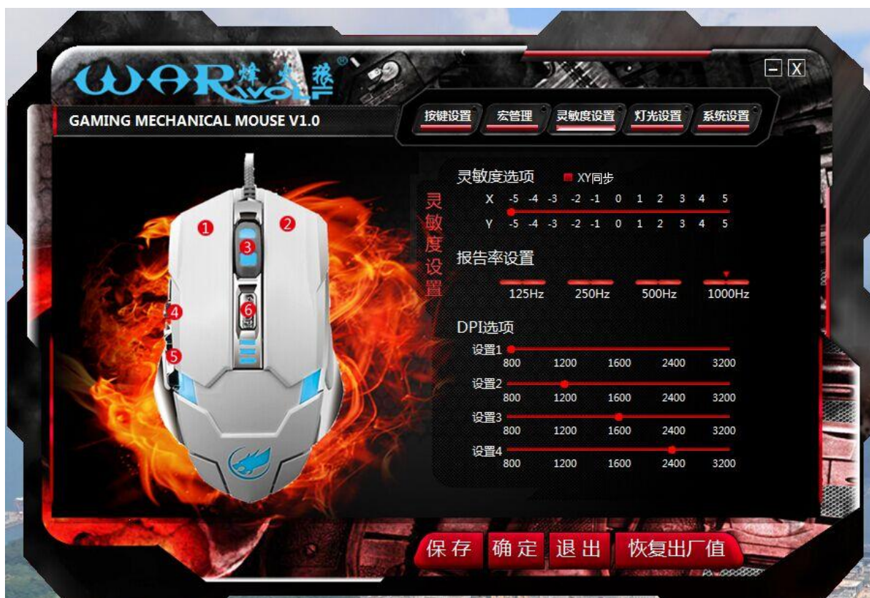
鼠标高级设定界面